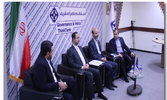
سهم اندیشکده‌ها در دیپلماسی علمی افزایش می‌یابد