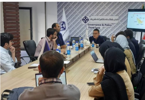
استاد چینی در اندیشکده حکمرانی شریف