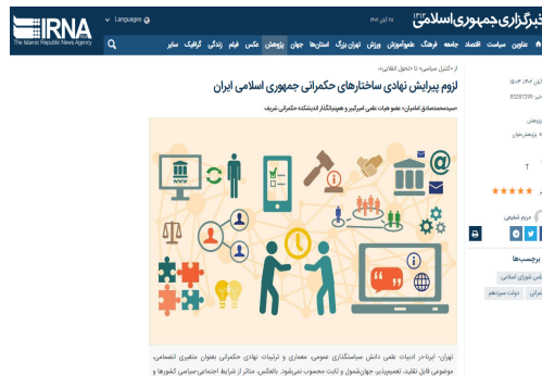
لزوم پیرایش نهادی ساختارهای حکمرانی جمهوری اسلامی ایران