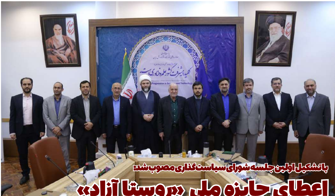
با تشکیل اولین جلسه شورای سیاست‌گذاری مصوب شد: